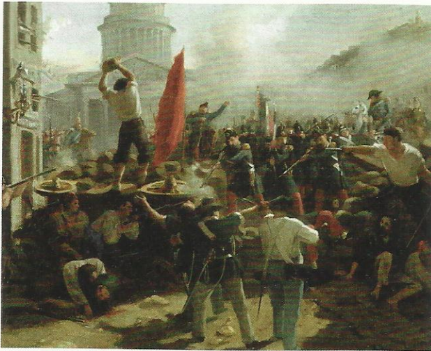
Barykada na Rue Soufflot [czyt.: ri suflo] to obraz Horace'a Verneta [czyt.: orasa werneta], na którym ukazał on wydarzenia z czerwca 1848 r., kiedy to wojska republikańskiego rządu stłumiły powstanie robotników na ulicach Paryża.

nowe władze, które jednak nie zamierzały dalej spełniać oczekiwań środowisk robotniczych i zlikwidowały warsztaty narodowe. Wywołało to w czerwcu 1848 r. powstanie robotników w Paryżu, krwawo stłumione przez wojska rządowe. Jesienią tego roku uchwalono nową konstytucję, na mocy której najwyższą władzę w państwie powierzono jednoizbowemu parlamentowi, a władzę wykonawczą – prezydentowi. Organy te były wyłaniane w wyborach, w których mogło oddać głos około 9 mln mężczyzn. W grudniu 1848 r. pierwszym prezydentem republiki został Ludwik Napoleon Bonaparte – bratanek Napoleona I.