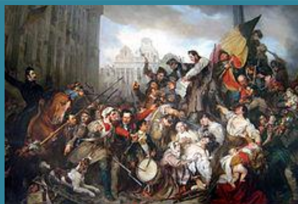
Egide Charles Gustave Wappers, Epizod z belgijskiej rewolucji 1830