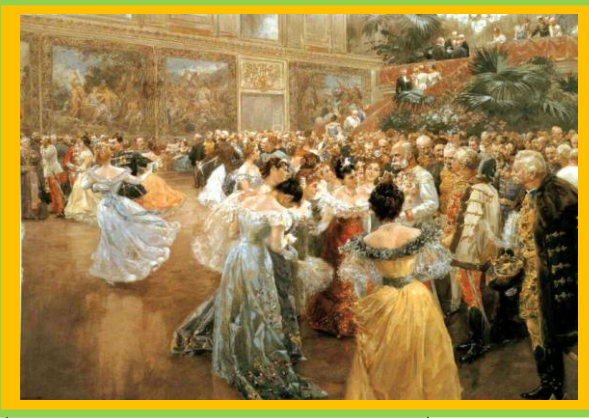
Bał w Hofburgu - wiedeńskim pałacu władców Austrii

Kongres Wiedeński miał uporządkować skomplikowane problemy dynastyczne, ustrojowe i graniczne w ponapoleońskiej Europie. Organizatorzy mieli nadzieję, że podjęte w stolicy Austrii decyzje stworzą podstawy trwałego pokoju na kontynencie.