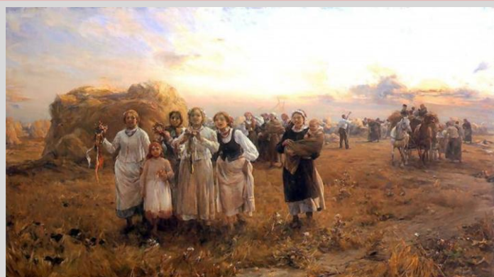
Dożynki - obraz Alfreda Wierusza-Kowalskiego

Nazwa wywodzi się stąd, iż posiadali zagrodę (chata z małym podwórkiem i zabudowaniami gospodarczymi), mogli również posiadać ogród i mały skrawek pola. Jego wielkość nie była duża, najwyżej kilka mórg (1 morga=0,55 hektara).