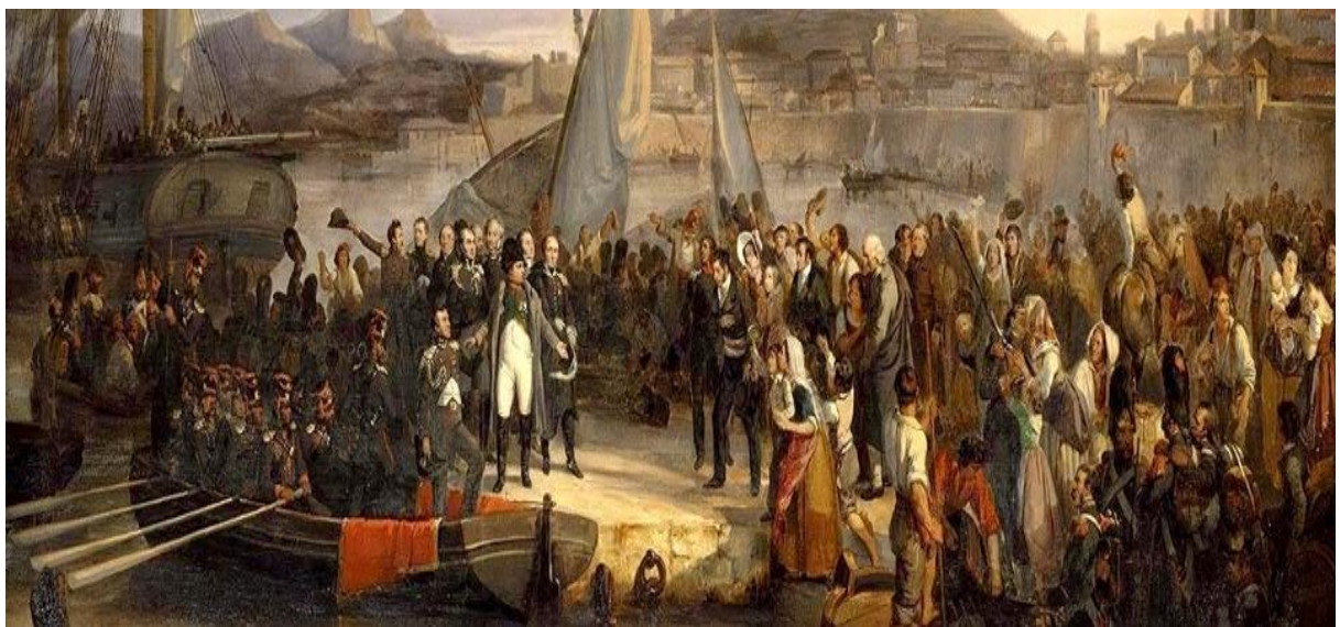
Napoleon opuszcza Elbę (obraz Josepha Beaume)

Wykonaj w formie pisemnej. Podręcznik str.17, zad 1,2.