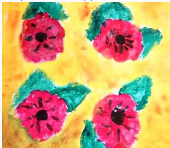
MAKI - pierwszy obraz namalowany po śmierci babci.